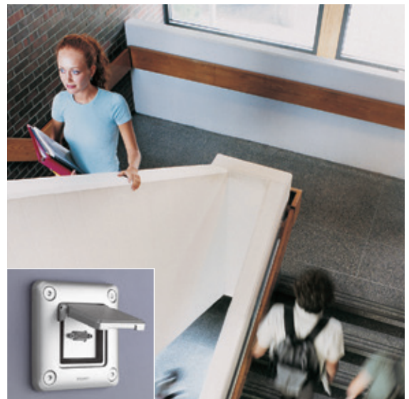
ENSEIGNEMENT | Adaptateur Mosaic avec volet (ici prise HD 15 Mosaic)