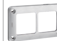
ALLIAGE MÉTALLIQUE | Plaque de finition pour une robustesse garantie en 1, 2 ou 3 postes (montage horizontal ou vertical)