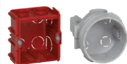
3 VERSIONS DE BÔÎTES D'ENCASTREMENT | Reçoivent toutes les fonctions Soliroc