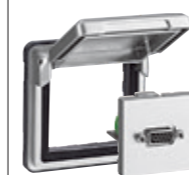
ADAPTATEUR MOSAIC | Pour installer les fonctions du Programme Mosaic