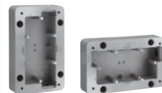
CADRES SOLIROC 1 OU 2 POSTES | Pour un montage en saillie