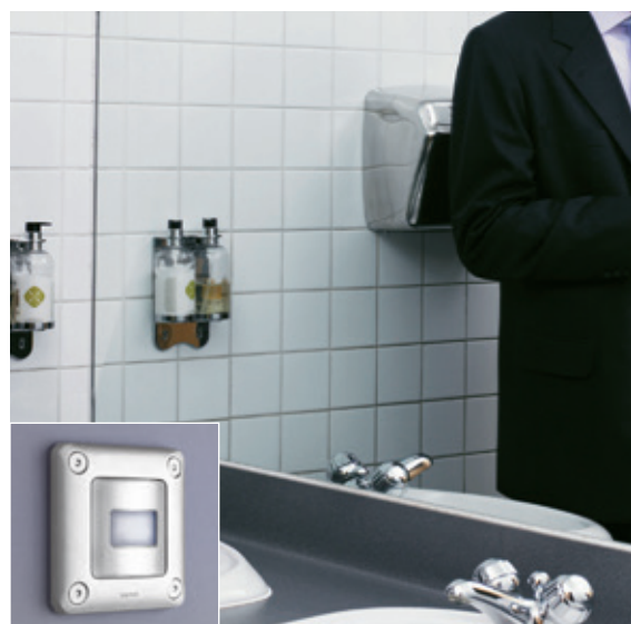
SANITAIRE PUBLIC | Interrupteur automatique