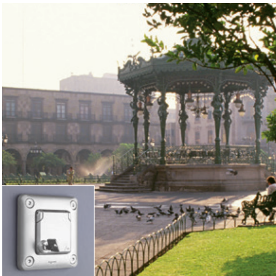
JARDIN PUBLIC | Prise 2P+T à clé avec volet verrouillé