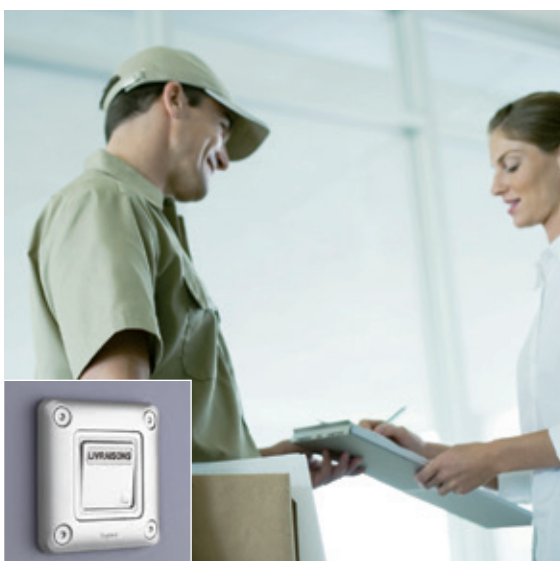
BUREAU | Poussoir porte-étiquette