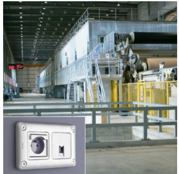
ENTREPÔT | Prise 2P+T + prise RJ 45