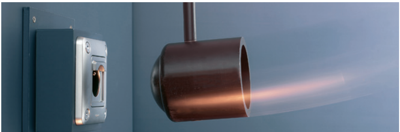
IK 10 : RÉSISTANCE AUX CHOCS MAXIMALE | Tous les produits résistent à des chocs de 20 joules

Tous les produits du Programme Soliroc ont subi avec succès les épreuves les plus sévères afin d'offrir une garantie de sécurité maximale.