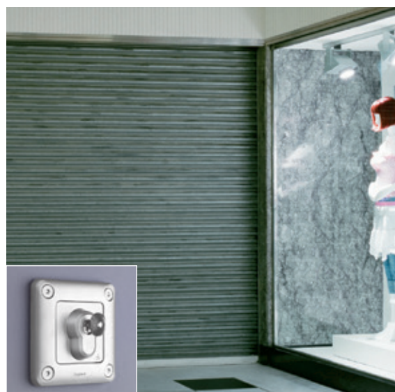
DEVANTURE COMMERCIALE | Interrupteur à clé