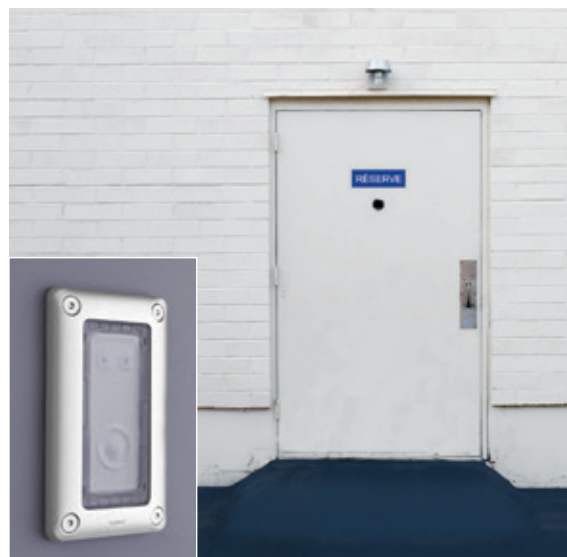
LOCAL À ACCÈS RÉSERVÉ | Lecteur à badge