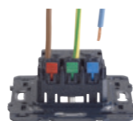
MÉCANISMES AVEC BORNES AUTOMATIQUES | 13 fonctions avec bornes automatiques Gain de temps assuré au câblage