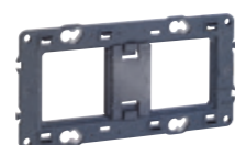
SUPPORT UNIVERSEL | Pour clipper tous les mécanismes Soliroc Entraxe 71 mm en horizontal et vertical