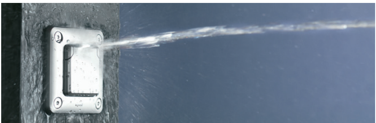
IP 55 : ÉTANCHÉITÉ GARANTIE | Sur les principales fonctions pour une installation en extérieur