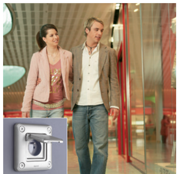
GALERIE COMMERCIALE | Prise 2P+T avec volet